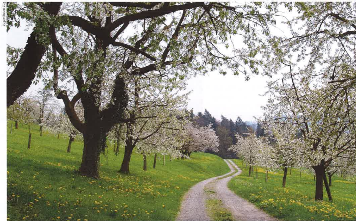
In diesem Jahr ist die Kirschbaumblüte schon vorbei. Nächsten Frühling können Sie unter der Nummer 041 511 75 00 beim Chriesitelefon von Zug Tourismus erfahren, ob und wo die Zuger Chriesiblauescht schon begonnen hat.

Doch der Kirsch ist schon lange in Zug zuhause. «Es ist heuer genau 400 Jahre her, dass der Kirsch zum ersten Mal in Zuger Unterlagen erwähnt wurde. Es wurde nämlich eine Verwarnung erteilt, weil die Kirsche als Grundnahrungsmittel galt und es damals nicht erlaubt war, die Kirsche