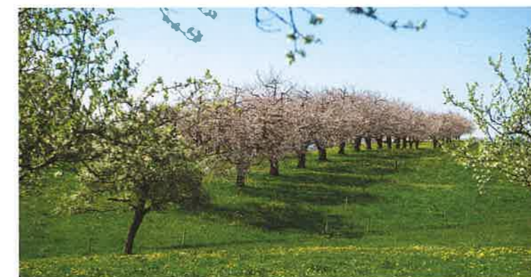
75 Bauernbetriebe liefern Etter Söhne AG die Chiesi für die Kirschproduktion. Um den Kirsch Zuger Kirsch nennen zu dürfen, muss das Steinobst aus einem bestimmten Umkreis rund um Zug stammen.