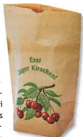
Zuger Chriesi Zug