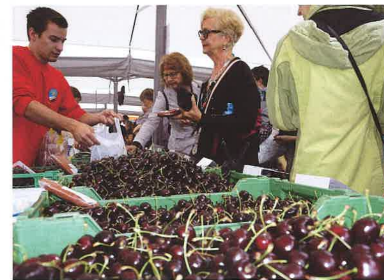
Zuger Chriesi Zug

Schon im Lied «Chom mier wei go Chrieseli gönne» wird es deutlich: Es gibt rote, schwarze und gelbe Kirschen. In der Schweiz kennen wir zwischen 350 und 400 verschiedene Kirschensorten. Dabei wird vor allem zwischen süssen und sauren Kirschen unterschieden. Die Steinfrucht enthält Nährstoffe wie Kalzium, Antioxidantien und Vitamin C. Da Kirschen nicht nachreifen, empfiehlt es sich, sie schon voll reif zu kaufen. Wer sie nicht sogleich essen möchte, kann sie, am besten mit dem Stiel, einfrieren.